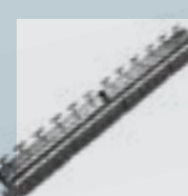
PATCH PANEL CAT 6A