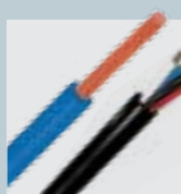
CABOS BAIXA TENSÃO