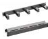
Organizador de Cabos