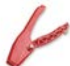
Ferramenta de Conforto