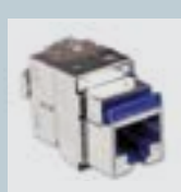
CONECTOR CAT 6A