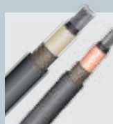
CABOS MÉDIA TENSÃO