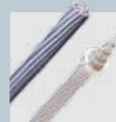
CABOS ALUMÍNIO NU