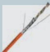
CABO CAT 6A

A solução LANmark CAT 6 é ideal para uma rede Ethernet de 10 Gigabit, desenhada especificamente para suportar as frequências mais elevadas requeridas para 10 Gigabit Ethernet, mantendo a compatibilidade total com as necessidades dos dias de hoje. Os produtos LANmark CAT 6A são blindados, a fim de garantir a imunidade a Alien Crosstalk e outras interferências externas.