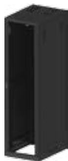
Rack de Piso