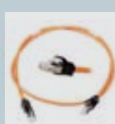
PATCH CORD CAT 6A