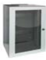
Rack de Parede