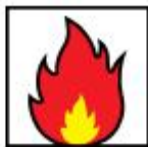
Retardante ao fogo