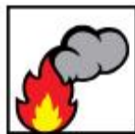
Baixa emissão de fumaça