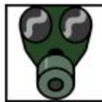
Baixa emissão de gases tóxicos