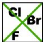
Livre de halogênio