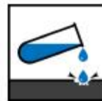
Baixo grau de acidez